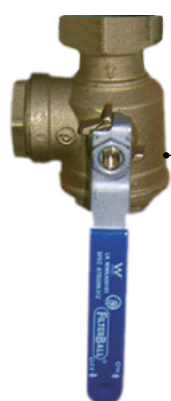
Guľový uzáver 1" s filtrom