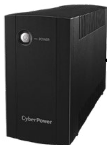
Záložný zdroj UPS, 230 V, 800 VA / 480 W